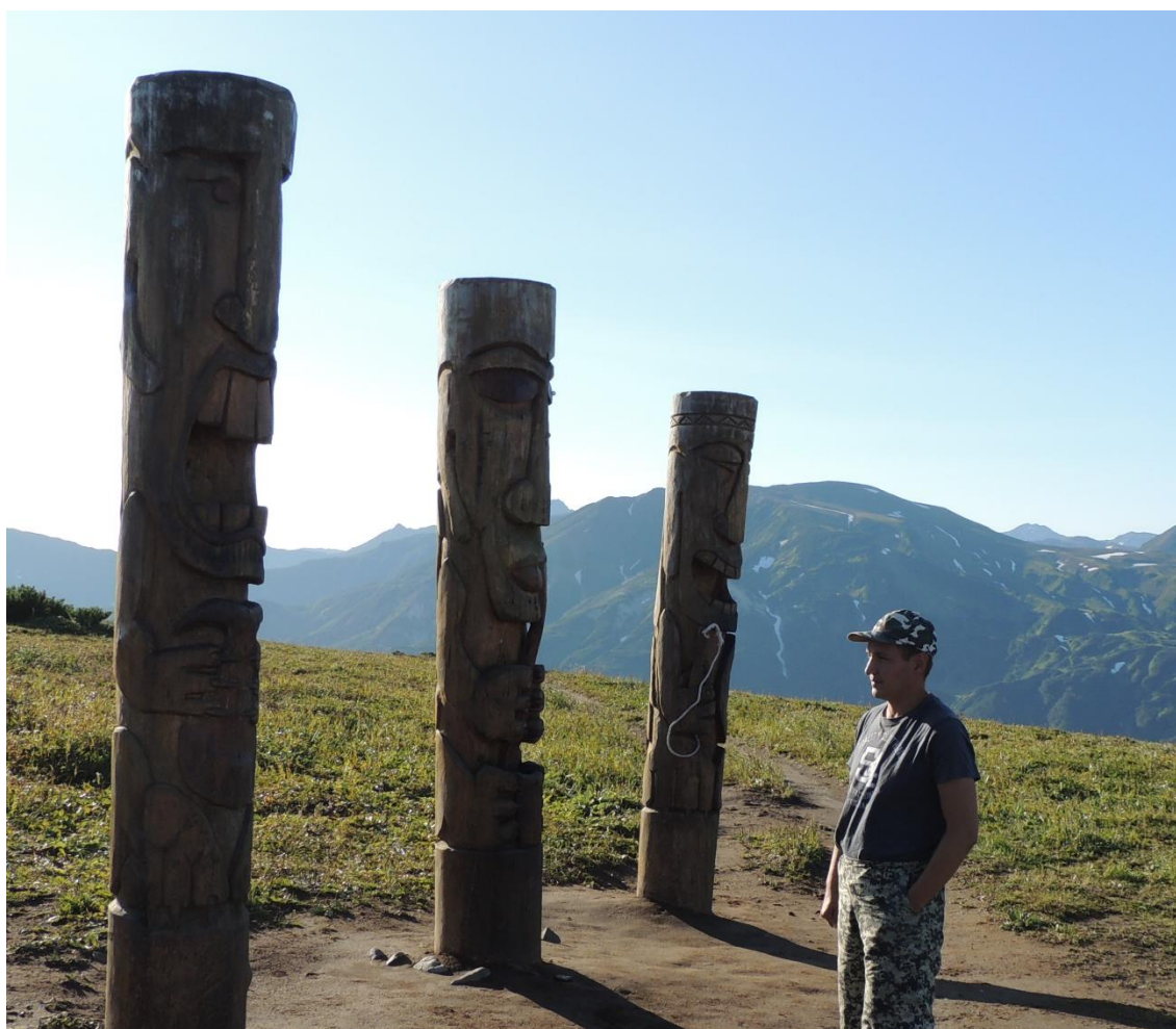
Фото 1. В стране народа анкалаку. 05.09.2017, Камчатка, дорога к вулкану Горелый.

Если вы знаете хорошо тюркские языки, а особенно чувашский, то приехав на Камчатку вы сможете на уровне корневых базовых слов пообщаться с представителями народа керек (анкалаку) на их языке.